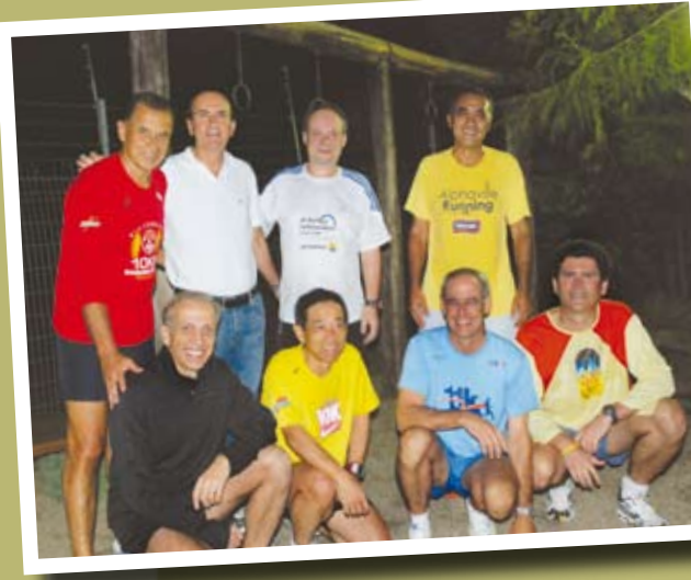
A turma da corrida: sem stress